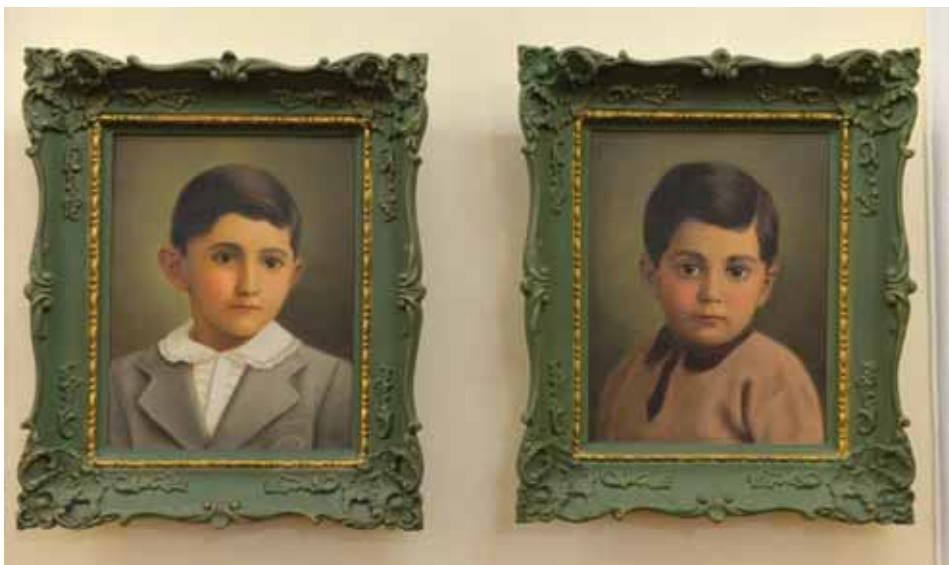
پرتره کودک، رنگ و روغن اثر رضا صمیمی، ۲۷×۲۵