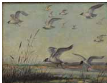
راست: طبیعت بی‌جان، رنگ و روغن اثر رضا شهابی، ۱۳۳۳ چپ: طبیعت، رنگ و روغن اثر حسین شیخ، سال نامعلوم، ۶۰×۴۰