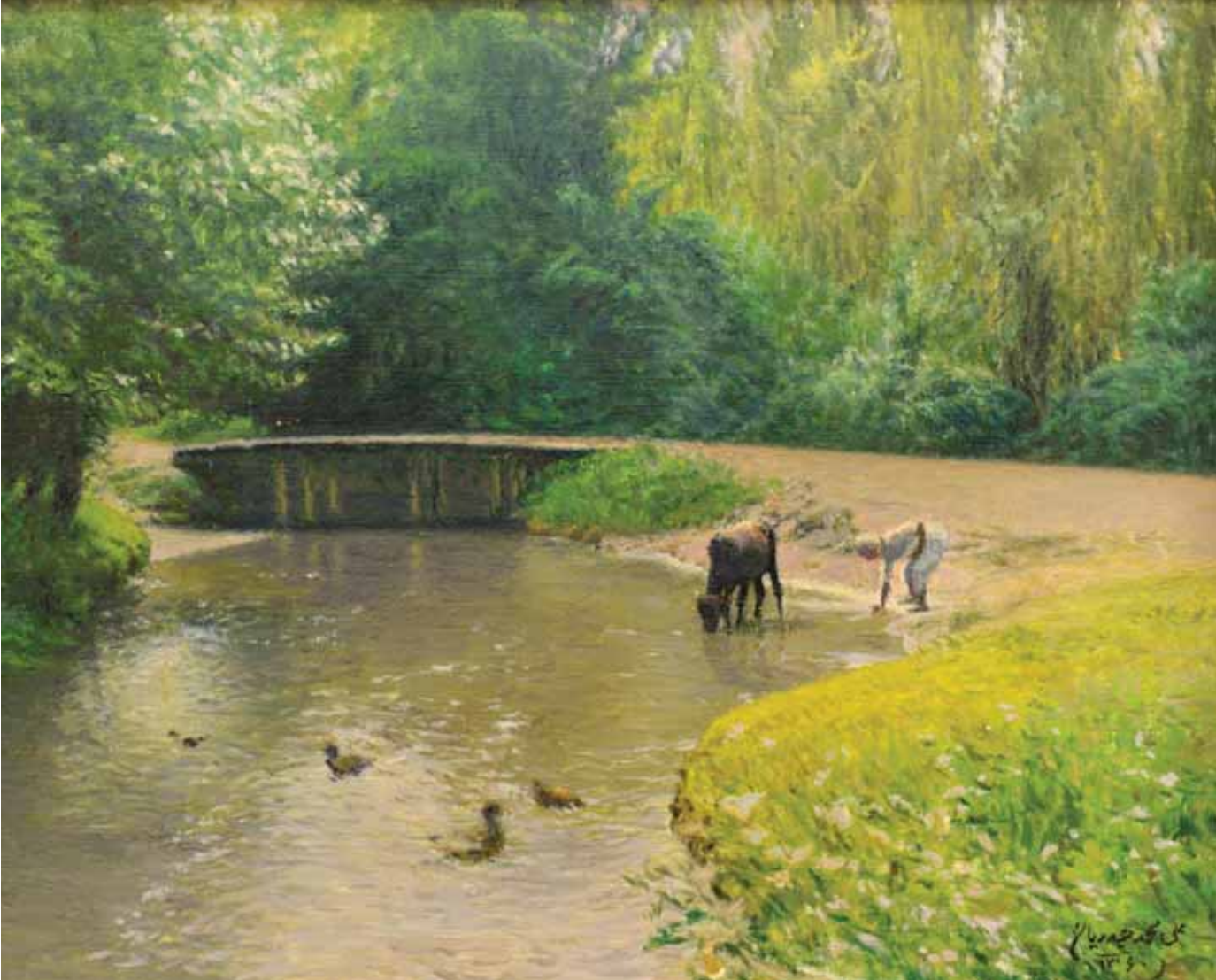
منظره، رنگ و روغن اثر علی محمد حیدریان، ۱۳۶۰، ۳۹×۵۳

دوره قاجار) مدرسه «صنایع مستظرفه» را در ضلع جنوبی باغ نگارستان تأسیس نمود. این مدرسه پس از «مجمع‌الصنایع ناصری»، دومین مکان آموزش آکادمیک هنر در ایران محسوب می‌شود. استاد، پس از کناره‌گیری از مدرسه، به روستای حسین‌آباد نیشابور رفت و سرانجام در ۱۳۱۹ به علت کهولت سن، در بیمارستان شاهرضای مشهد درگذشت.»