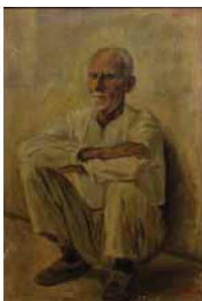
طبیعت بی‌جان، رنگ و روغن علی کریمی، ۵۰×۶۵، ۱۳۲۶