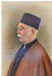
پرتره کمال الملک، رنگ و روغن اثر مؤیدپردازی، ۱۸×۱۸