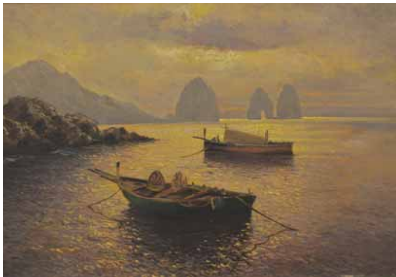
دریا، رنگ و روغن اثر محسن سهیلی، ۷۰×۵۰، ۱۳۲۴

را در کارشان می‌توان مشاهده کرد. به هر تقدیر موزه تازه‌تأسیس کمال‌الملک گامی بزرگ برای شناخت و مطالعه میراث هنری این مکتب است. فضای این موزه باغ نگارستان است که بسیار مفرح و شادای بخش می‌باشد و آثار گهرنشان مکتب کمال‌الملک را همچون صدف در بر گرفته است. افزون بر این آثار، نمونه‌هایی از آثار حجم، ماکت و لباس‌های اقوام ایرانی بر لطف و زیبایی موزه افزوده است. شایسته است مدرسان و دانشجویان هنر برای تلطیف حس زیباشناسانه و انرژی گرفتن برای کار بیشتر به این مکان که در ضلع شمالی میدان بهارستان قرار دارد، رفت‌وآمد کنند. از خاطر نبریم در این فضای زیبا با معماری خاص آن همراه با کتیبه‌های قوی خوش‌نویسی با آثار گران‌قدر رهروان کمال‌الملک بهترین فرصت برای بازدید دانش‌آموزان فراهم آمده است. در ادامه، تصاویری از نقاشی‌های موزه کمال‌الملک و باغ نگارستان را ملاحظه می‌کنید.