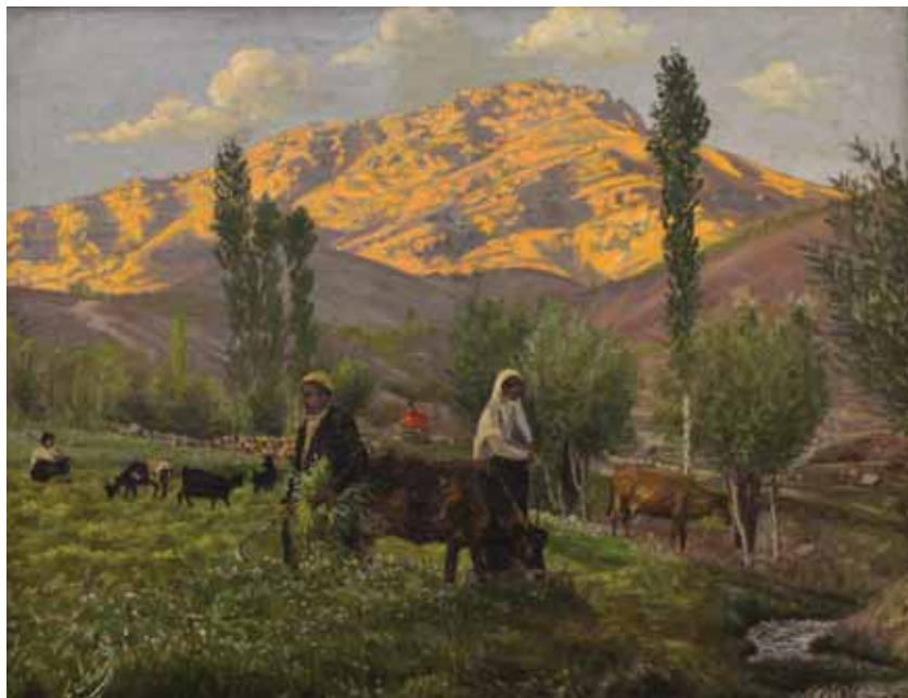
منظره روستا، رنگ و روغن اثر مصطفی نجمی، ۱۳۲۸، ۷۱×۵۵