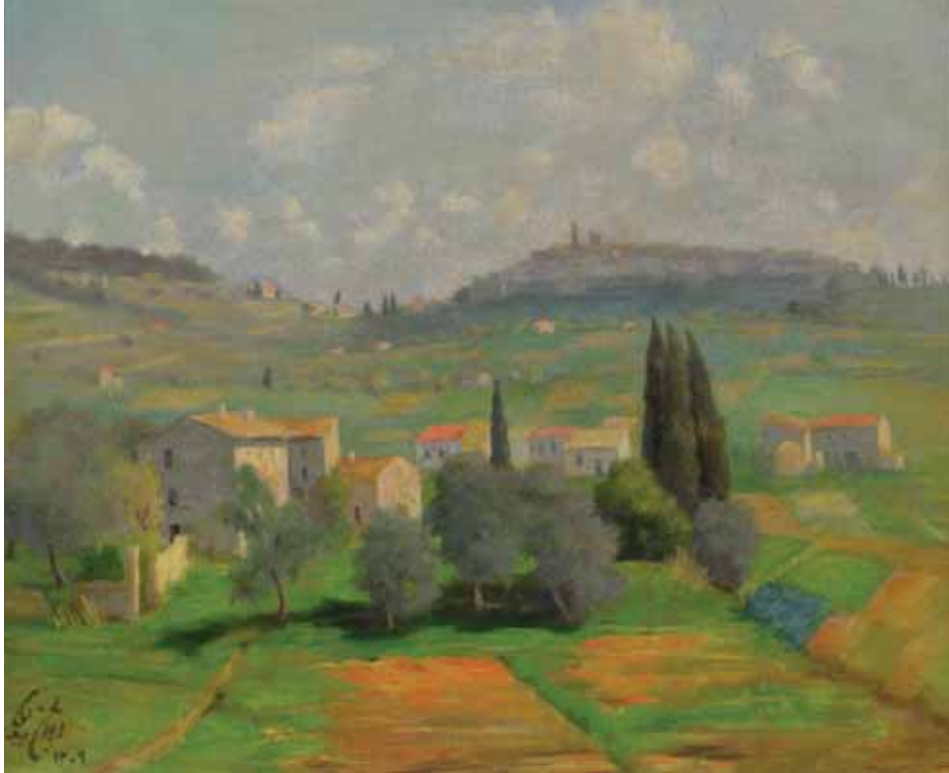
منظره جنوب فرانسه، رنگ و روغن اثر ابوالحسن صدیقی، ۱۳۰۹، ۶۲×۵۲