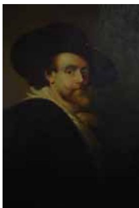
پرتره، رنگ و روغن اثر نجم آبادی